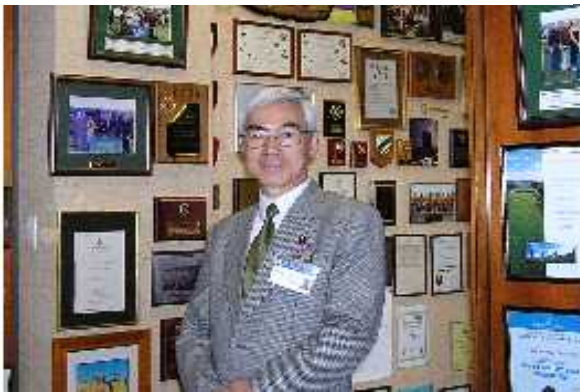
ゴスフォード市役所にて

現在、ホームページの更新を進めています。 未だ、まだパソコンの技量が未熟で新聞や ホームページを作るのに苦労しています。 是非、お知り合いの方にご一読を下さいま すようお願い致します。 新聞も12月、2月、6月と発行しました。 HP掲載と友人の手配り、一部は郵送で支援 者の皆様にご覧いただいています。